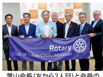
葉山会長(左から2人目)と会員のみなさん

調布市協の職員が調布のまちを元気に走り回れるようにと、電動自転車1台を、さらにクラブ創立35周年記念として10万円をそれぞれご寄付いただきました。