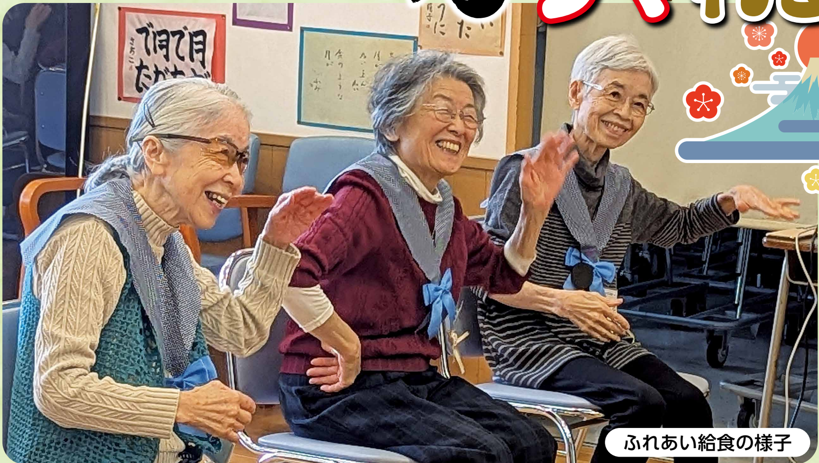
ふれあい給食の様子