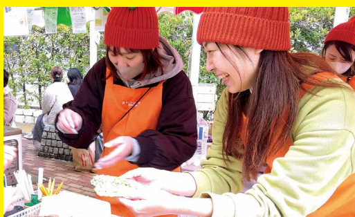
▲どのテントも出会いと笑顔でいっぱい