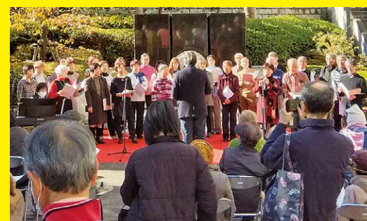
▲ステージに素敵な歌声が響きわたりました