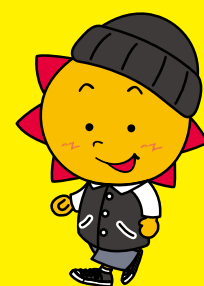
福祉まつりキャラクター 「サニーくん」

2日間で大勢の方にご来場いただき、たくさんの“あい”と“スマイル”が溢れる楽しいおまつりとなりました。今年の第49回も、みなさんのお越しをお待ちしています。