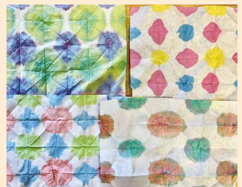
調布市立第一小学校 ひまわり学級 「いろとりどり」