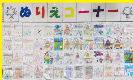
▲色とりどりの個性豊かなサニーくんが大集合