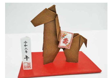
「干支の午」菊野台折り紙クラブ