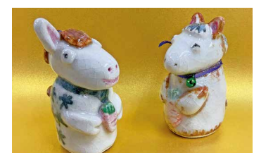
陶芸「干支の午」よつば利用者の作品