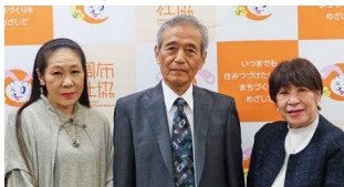
美野女性部長(右)より

10月12・13日に開催された第70回調布市商工まつりにおいて、今年も商工会女性部のみなさんが名物「ふみ焼き」を販売し、その売上げ5万円をご寄付いただきました。女性部のみなさんには、共同募金などで資材準備にもご協力いただいています。