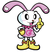
調布市協キャラクター ちょビット