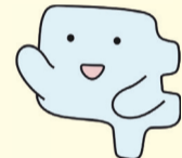
市民活動支援センター キャラクター えんがわくん

☎ 受付期間 8月31日(月) 17時まで ☎ 市民活動支援センター ☎042-443-1220