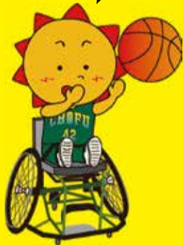
福祉まつりキャラクター「サニーくん」

調布駅前広場 グリーンホール (小ホール) 総合福祉センター たづくり (10F 茶室) ※日曜のみ