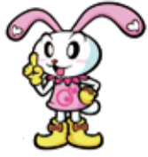
調布社協キャラクター ちょびット