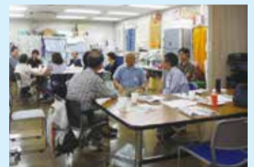
▲ひきこもり家族懇談会 (毎月第2土曜午後開催)

様々な相談を受ける中で、市全域の課題と思われる1つに「ひきこもり」があります。昨年度よりひきこもりで悩むご家族を中心に、NPO法人やボランティア、社協内の部署と協力し、「ひきこもり家族懇談会」を立ち上げました。お一人で悩まず、まずは誰かに話してみることで、一緒に考えるきっかけを作れたらと思っています。申込は不要、途中参加や退出も自由です。ぜひご参加ください。