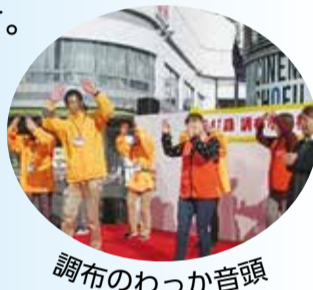
調布のわっか音頭