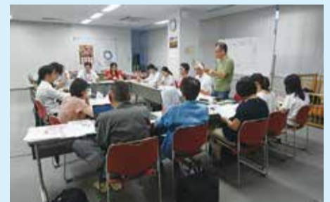
▲子ども食堂ネットワーク会議の様子