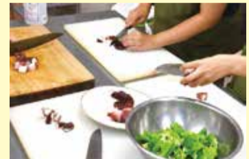
調理実習も行っています。

家庭の事情などにより、進学や就職をあきらめてしまうことがないように、子ども・若者に対して学習支援や居場所の提供を行うとともに、進学や自立に向けた相談支援を行っています。例えば、「外出できるようになりたい」「勉強についていけない」「何か目標を持ちたい」といったご相談に応じています。事業の