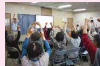
参加されたみなさんに介護予防体操をご紹介します！ (染地地域福祉センターにて)

地域のさまざまな活動や話し合いの場などに参加し、みなさんの声を聴いていますので、ぜひお声掛けください。