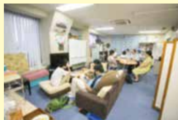
ココアカフェの様子

利用には事前の申し込みと面談などの手続きが必要ですので、まずはお問い合わせください。