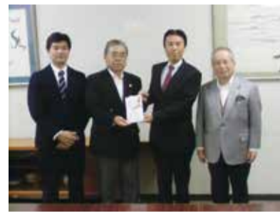
加藤会長(左から二人目)より、手渡されました。

ご寄付をいただきました 調布市民ゴルフクラブ様より 10月19日にメイプルポイントゴルフクラブで開催されたチャリティーゴルフ大会収益金として、調布社協に寄付金30万円をいただきました。