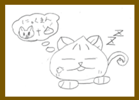
第一小学校 きこえの教室ことばの教室