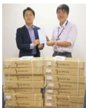
渋谷社長(左)よりいただきました。

チューリッヒ生命(チューリッヒ・ライフ・インシシュアランス・カンパニー・リミテッド)様より