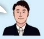
中村 染地・杉森・布田 小学校地域

地域の活動やイベント、会議などに参加する中で「地域のために何かできたらいいな…」 「地域住民向けの居場所づくりをしたい」などのご相談をいただき、一緒に考え、作り上げていくためのお手伝いをしています。