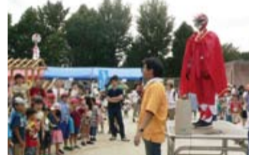
YDAS マンもやってくる !