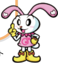
調布社協キャラクター ちょビット