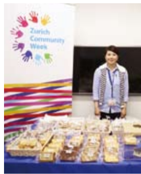
社員も楽しみにしている活動です！

今年も5月下旬にCSR(企業の社会的責任)活動で実施した「チャリティ・スイーツ・デイ」の売上金7万6千150円を、ご寄付いただきました。同社は毎年、社員の御寄付と同額を会社も寄付するマッチング寄付の取組を行っています。ありがとうございました。