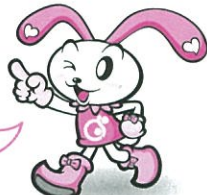
調布社協キャラクター ちょビット