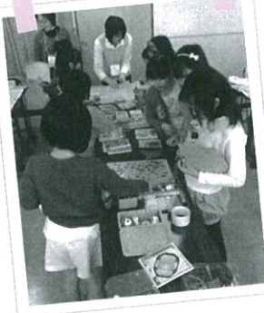
染地で気軽に子どもたちが立ち寄ることのできる、子どもの居場所です。

過去2年間(平成26年度～平成27年度)の調布市地域福祉活動計画推進委員会から始まった取り組み