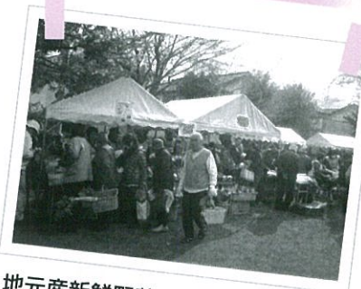
地元産新鮮野菜の販売、昔遊びなどを通して、交流を図っています。