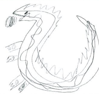
柏野小学校かにかやま教室児童作品