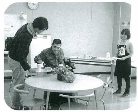
障がいのある方への接客体験のようす（詳細は2面へ！）

障がいがあってもなくても、 誰もが分け隔てられることなく、 おたがいを尊重して暮らせる 「共に生きる社会」を 実現することなんだって！ 次のページで説明するよ♪