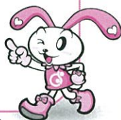
調布社協キャラクター ちよビット