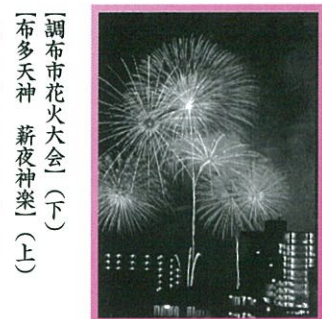
〔調布市花火大会(下) 一布多天神 薪夜神楽(上)〕