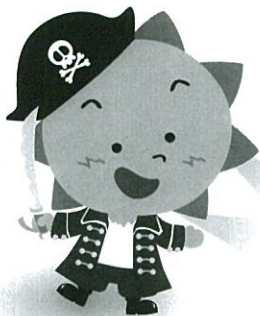
福祉まつりキャラクター 『サニーくん』