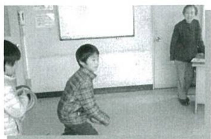
金子ふれあいまつり・輪投げコーナー