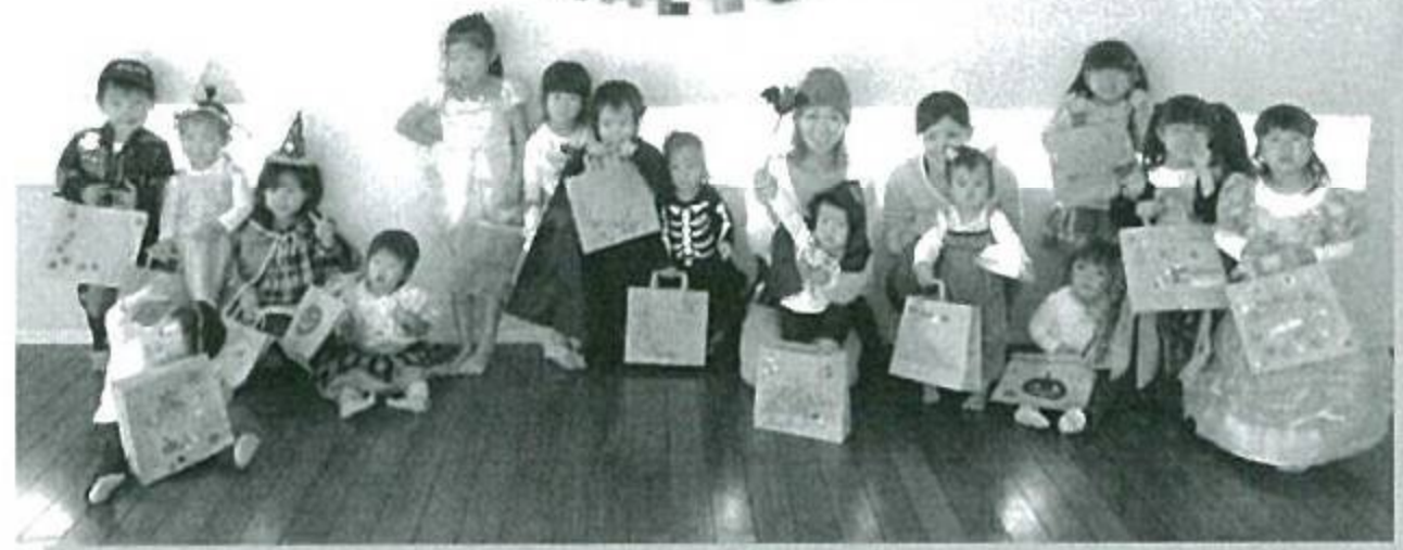
ひだまりサロン「アズランカ」