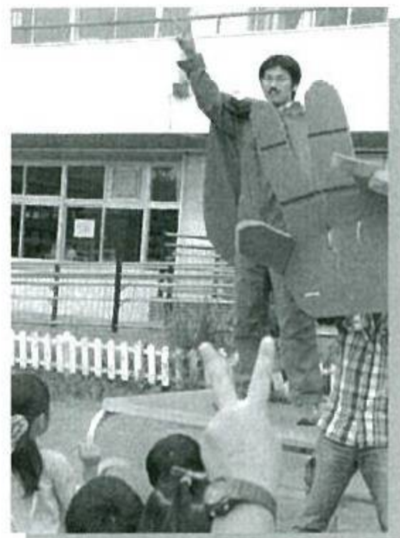
YDAS・じゃんけん大会