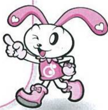
調布市協キャラクター ちょびット

調布は秋にもまだまだ あまつりがあるんだよ。 家族で「ちょっとそこ まて♪」でかけてみよう!