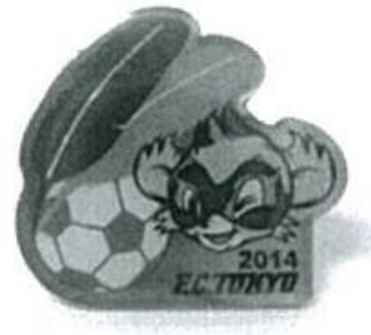
昨年度のバッジです！ 今年のデザインにも ご期待ください！！

ゼヒスタジアムに 足を運び、FC東京を 応援しながら、募金 活動にご参加ください。 日 10月17日(土)14時 キックオフ 所 味の 素スタジアム 問 共 同募金調布地区協力 会 ☎ 481-7617