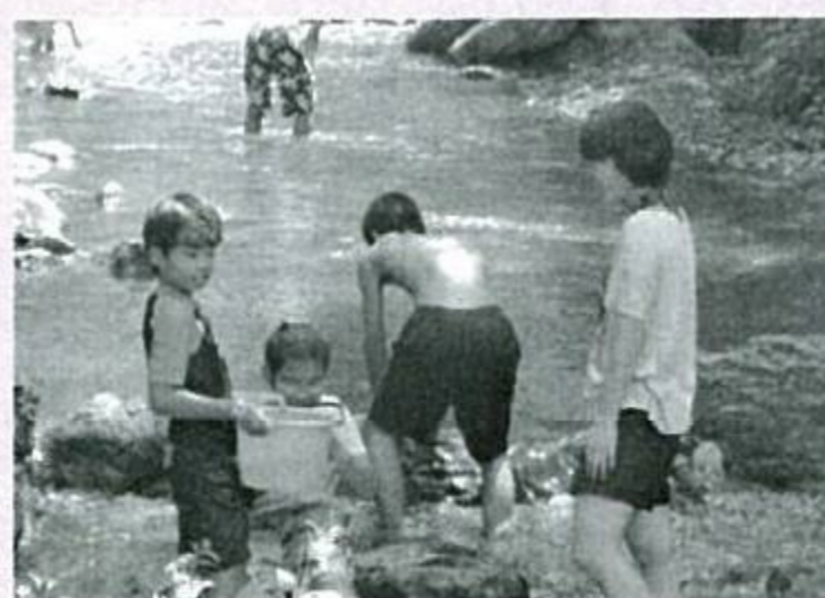
平成26年度は市内18の施設・団体が地域配分によって助成を受け、事業を実施しました。

食事も全て自炊とし、火おこしや川遊び、キャンプファイヤーなど、普段の生活では得られない貴重な体験の数々を仲間と共に取り組めたことは、子ども達の大きな自信になりました。