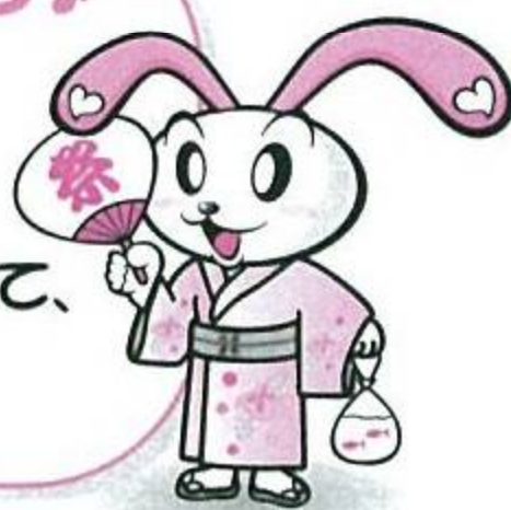
調布社協キャラクター ちょビット

夏はやっぱり花火だね。 楽しみだね~♪ いろんなイベントにごかけて、 夏を楽しもう!