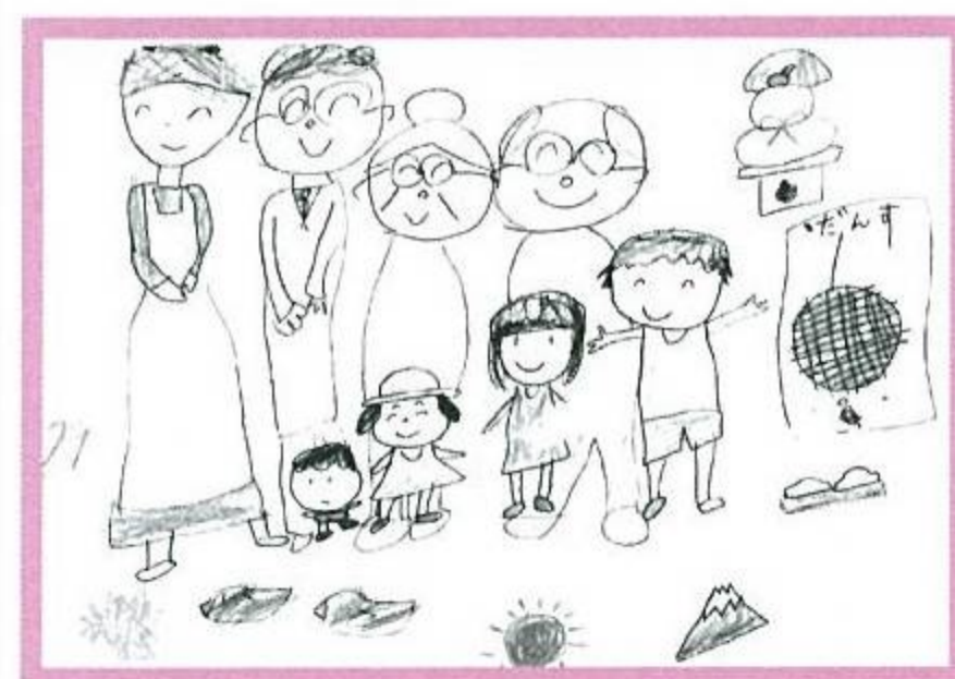
「びっころ」利用児童作品 放課後等デイサービス