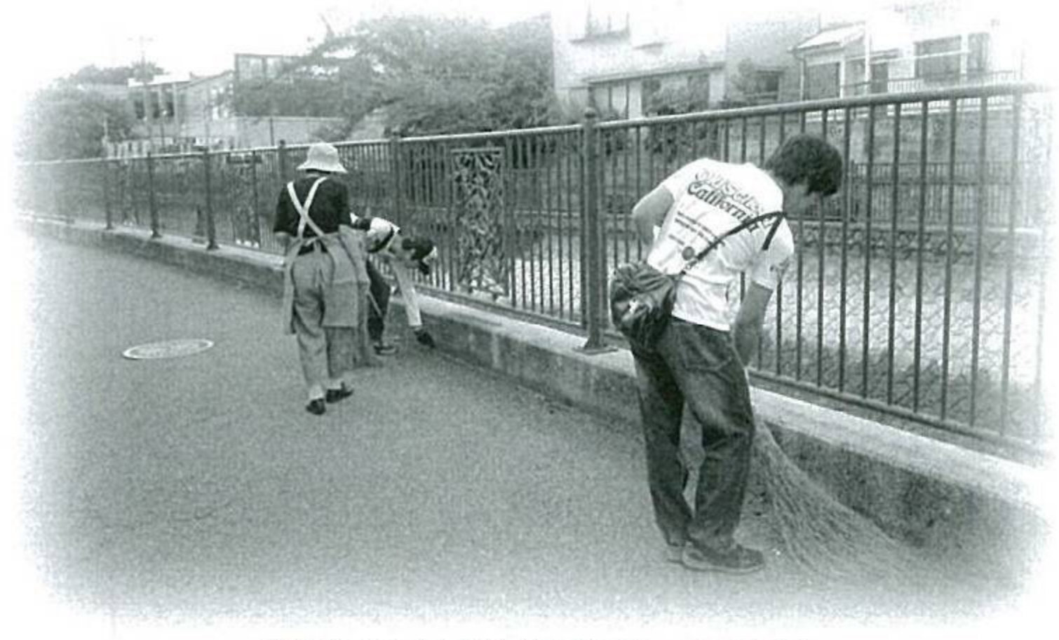
(学生による清掃ボランティア)