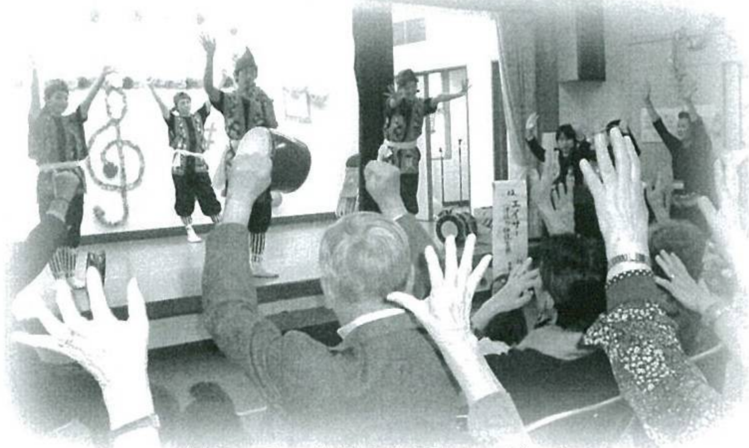
(緑ヶ丘・仙川ふれ愛のつどい)

地域の皆さんが知りあい、ふれあい、つながりが深まっています。地域福祉センター等市内13か所で行われています。