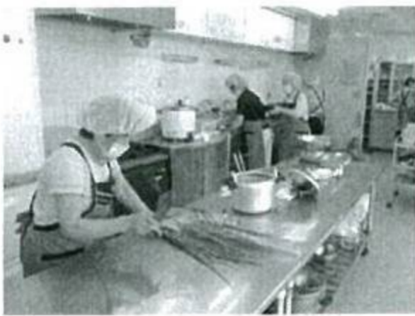
調布市希望の家 菓子製造販売 終了のお知らせ

活動は月1回で、時間は9時～15時です。調理経験や資格は問いませんが、資格は問いませんが、ユーザーが楽しみにしている昼食の調理活動に参加しませんか？見学は随時。お気軽にお問合せください。