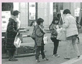
街頭募金の様子(仙川駅)

毎年「調布明るい社会づくりの会」の方々が調布市内の街頭にて街頭募金を実施しています。今年で9年目となる街頭募金は、12月の寒空の中、子供から大人まで「募金にご協力をお願いします」と師走で賑わう街中で呼びかけを行います。昨年は合計162,900円もの募金が集まりました。今年も12月13日(土)に市内5駅で実施を予定しています。詳細についてはHPなどでご確認ください。 駅の近くにご協力の際は、みなさんのあたたか