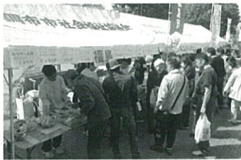
買って応援、食べて幸せ!