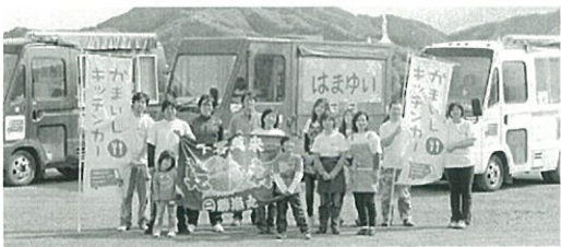
釜石からキッチンカーも来てくれます

流会、「石巻と調布希望のつながり」企画展など 【主】 「いま、私にできること」Make an Action」実行委員会 【共】 調布青年会議所、調布から！復興支援プロジェクト、調布市仏教会ほか 【協力】 市民活動支援センターほか 【問】 市民活動支援センター ※共に活動してくれるボランティア募集中！