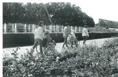
神代植物公園にて

ドルチェでは、障がいのある方のデイサービス事業を行っています。デイサービス「クローバー」は社会参加への第一歩として、書道や体操、音楽を楽しんだり、「うたごえドルチェ」や「単体操教室」に参加し、ドルチェを利用する方々 と交流しています。また、バラの咲く季節には神代植物公園へ出かけたり、カフェへ出かけてみんなで一緒にランチをしたりと、地域で外出する機会も増えていきます。 毎週火・木曜日 15時対 65歳未満