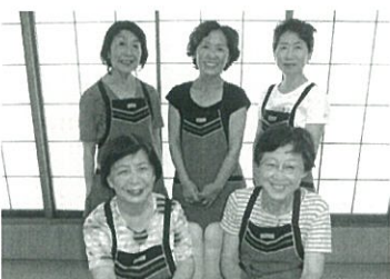
みなさん楽しみながら活動しています

総合福祉センターのデイサービス「アイビー」に手作り昼食を提供している「調布市いきいきクラブ調理運営協議会」では、一緒に活動していただけの方を募集しています。美味しく食べやすい家庭料理を月曜日から金曜日まで5人ずつ20グループが交替で作っています。季節感のあるメニューが利用者から「とても美味しい」と好評です。 活動時間はおおむね9時から15時まで。経験、資格は問いません。楽しく活動しながら料理の腕を上げたい方、そして料理の好きな方、月1回の活動からぜひご参加ください。 【問】 通所介護サービス係