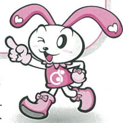
調布社協キャラクター ちょビット

紅葉が終わるとそろそろ冬支度！ 12月の福祉まつりではみなさんに会えるのが楽しみだなあ！ 風邪をひかないよう手洗い・うがいは忘れずに☆