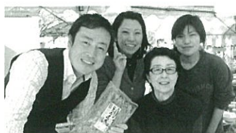
【石巻のワカメ生産者の方と、調布の仲間と宮城県山元町にて】

皆さん、こんにちは。リレーコラムの初回、大変光栄です。私たちの団体は、東日本大震災後、1週間後に宮城県石巻へ支援活動に行ったことがきっかけで、被災地支援に取り組んでいた人達が連携して生まれ、現在でも、調布を拠点に復興支援に取り組んでいます。メンバーは中学生から80歳以上の方まで。それぞれができることを、補い合いながら一緒に活動しています。主な活動は、調布市内イベントでの東北物産販売や、夏休みにサッカー少年を調布に招待する「調布・福島フレンドリーカップ」そして、東北に訪問しての交流等です。これからも、個人、団体、企業の皆さん、また東北出身の方々とも協力しながら、できることを、「細く」「長く」続けていきたいと考えています。皆様、よろしくお願ひいたします。