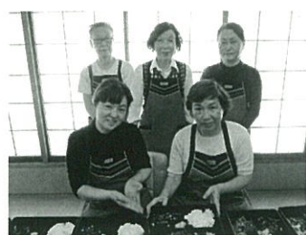
みなさん楽しみながら活動しています