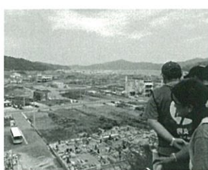
江岸寺高台から大槌湾を望む

入浴代等、概ね1万5千円(移動)貸切バス(宿泊)遠野市公共施設(申請)調布市被災者支援ボランティアセンターHPより応募用紙を印刷し、必要事項を記入の上FAXで市民活動支援センターまで(先着順)