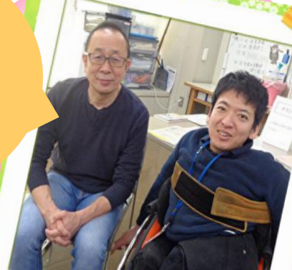
まつうら だいこうし 松浦 大光寺